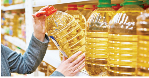
में 1.2 फीसदी की बढ़त हुई है, जो अब तक का ऑल-टाइम रिकॉर्ड है। अनाज की कीमतों में भी 0.8 फीसदी की तेजी देखी गई है।

खाद्य तेल और मीट की कीमतें सबसे ज्यादा बढ़ीं: रिपोर्ट के मुताबिक, सबसे ज्यादा असर खाद्य तेल पर पड़ा है। कच्चे तेल की कीमतें बढ़ने से बायो-फ्यूल की मांग बढ़ी है, जिससे वेजिटेबल ऑयल के प्राइज मार्च के मुकाबले 5.9 फीसदी बढ़े हैं। यह जुलाई 2022 के बाद का सबसे ज्यादा है। वहीं, मीट की कीमत