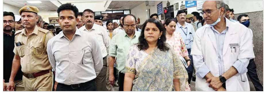
प्रमुख शासन सचिव ने जोधपुर में एमडीएम अस्पताल का औचक निरीक्षण कर व्यवस्थाओं का लिया जायजा

यहाँ मुख्य रूप से ऑटोमोबाइल पार्ट्स, इलेक्ट्रॉनिक सामान, और आधुनिक इंजीनियरिंग से जुड़ी इकाइयाँ स्थापित की जाएंगी। धिलौट में पहले से ही एक सिरामिक और ग्लास जोन मौजूद है, जिससे इस नए जापानी जोन को बेहतर इंफ्रास्ट्रक्चर और लॉजिस्टिक्स सपोर्ट मिलेगा।