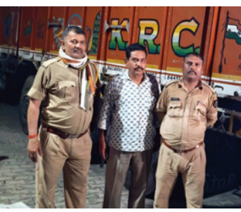
रोक लगाने एवं राजस्व क्षति को रोकने में सहायता मिलेगी।