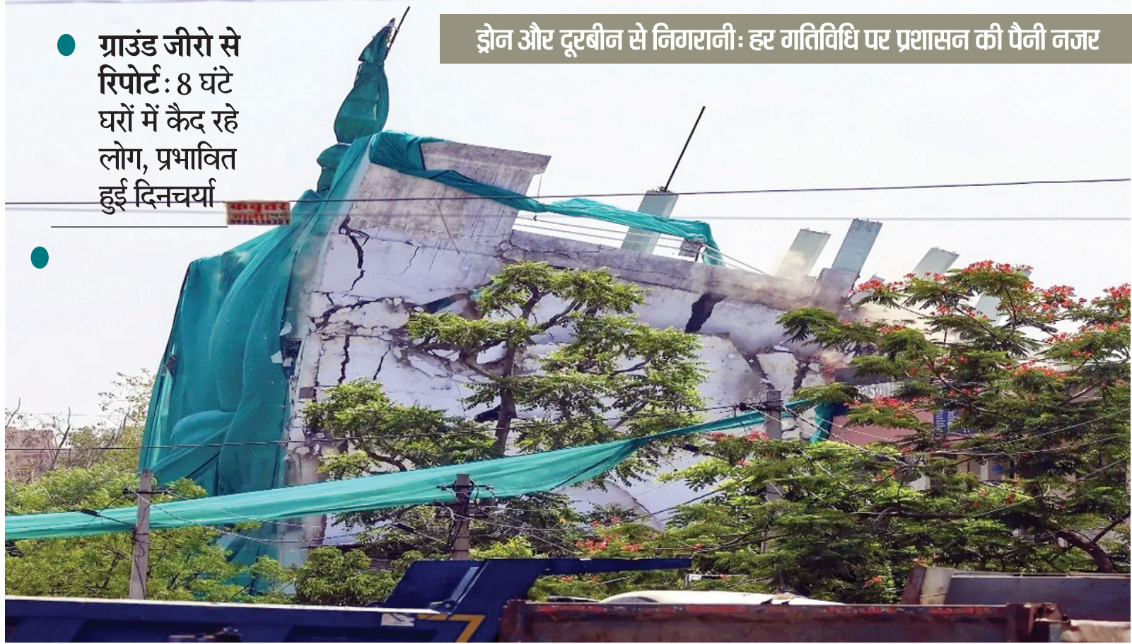
ड्रोन और दूरबीन से निगरानी: हर गतिविधि पर प्रशासन की पैनी नजर

● ग्राउंड जीरो से रिपोर्ट: 8 घंटे घरों में कैद रहे लोग, प्रभावित हुई दिनचर्या